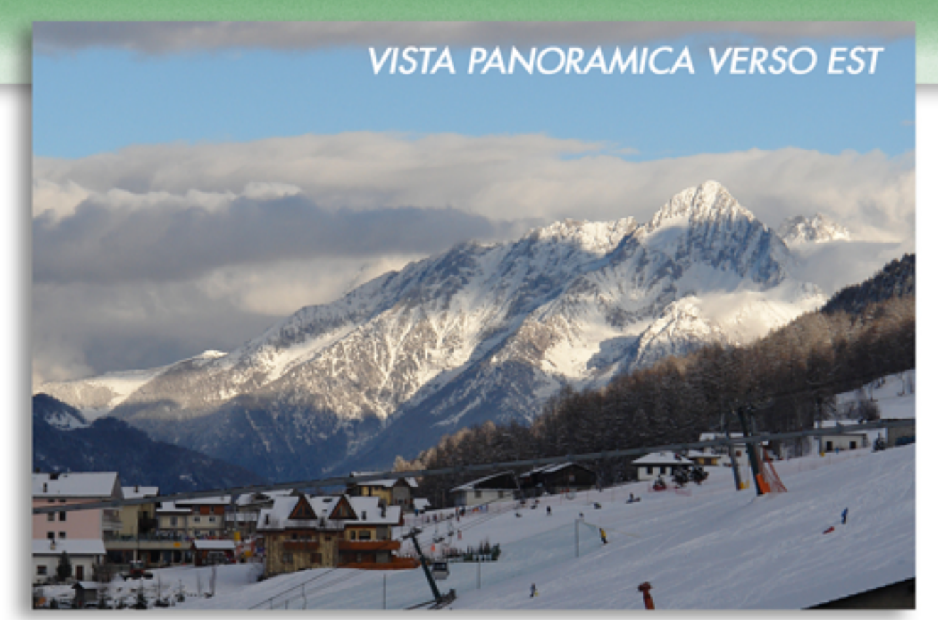
VISTA PANORAMICA VERSO EST