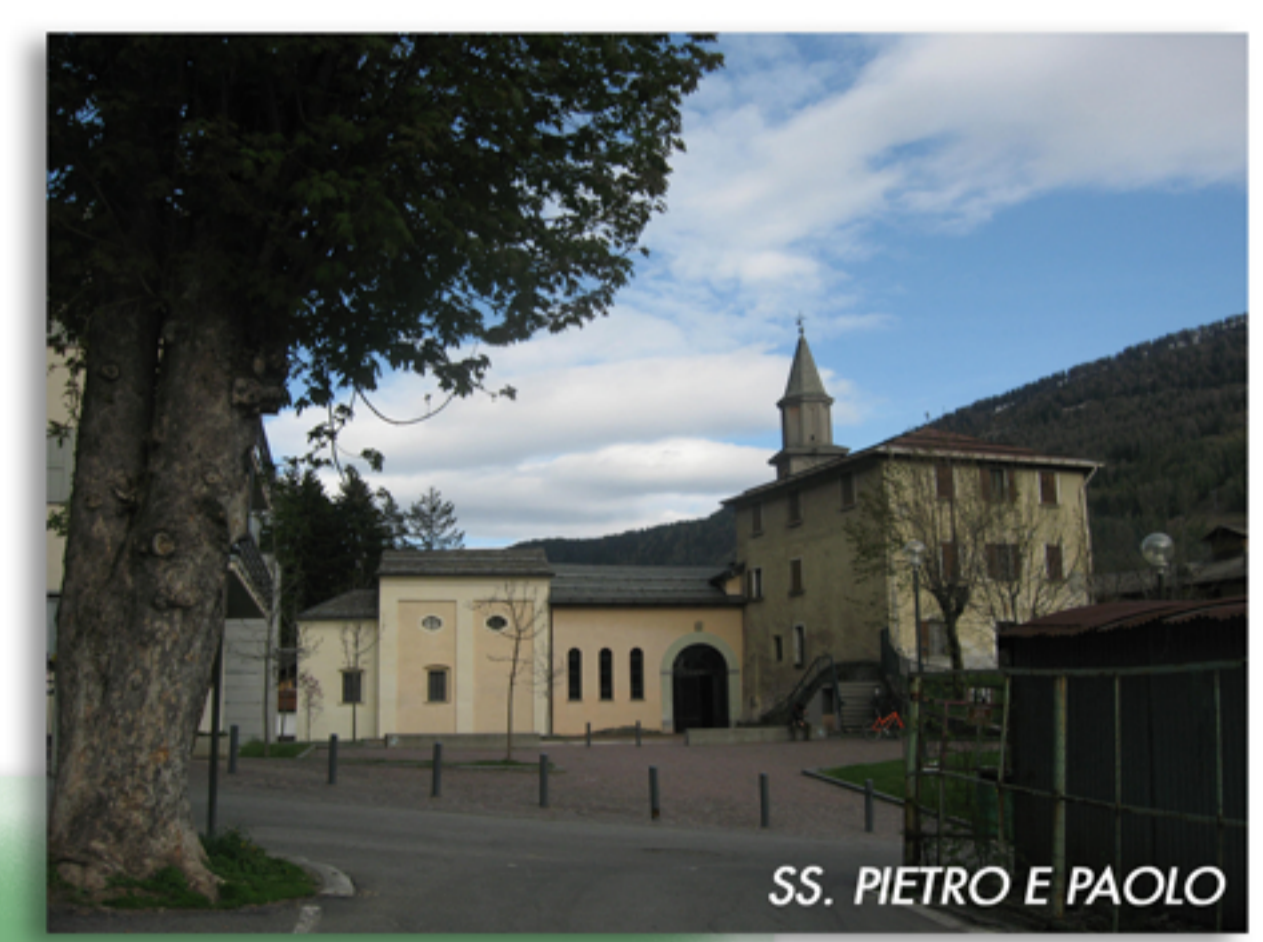
SS. PIETRO E PAOLO