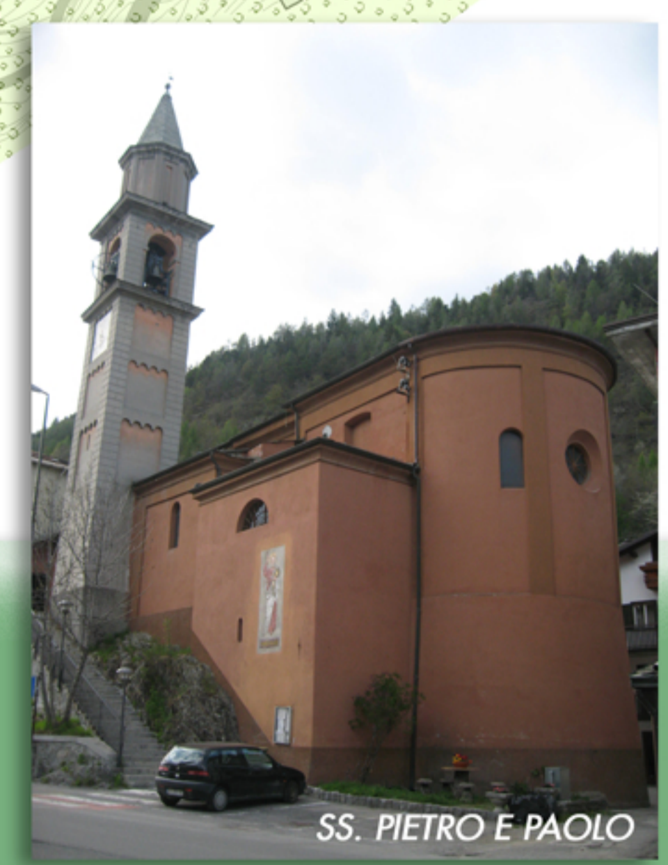
SS. PIETRO E PAOLO