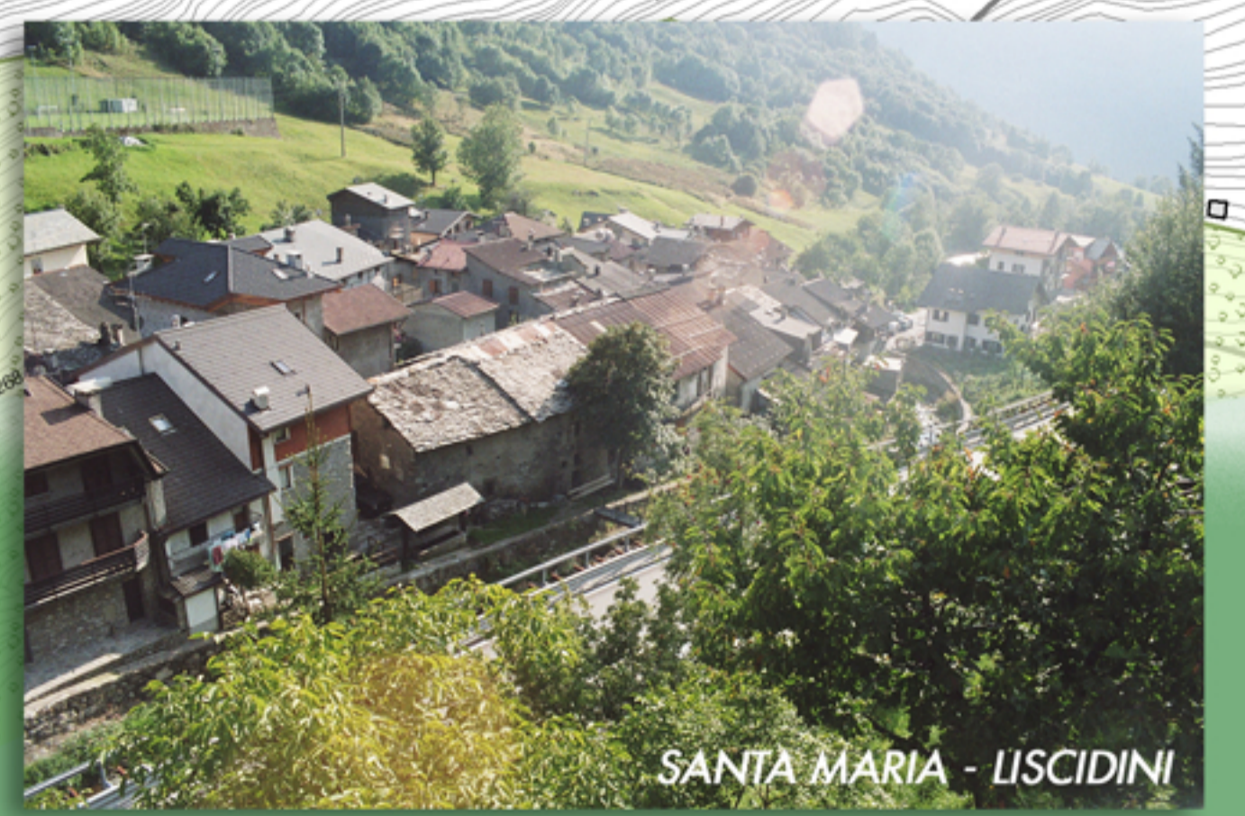
SANTA MARIA - LISCIDINI