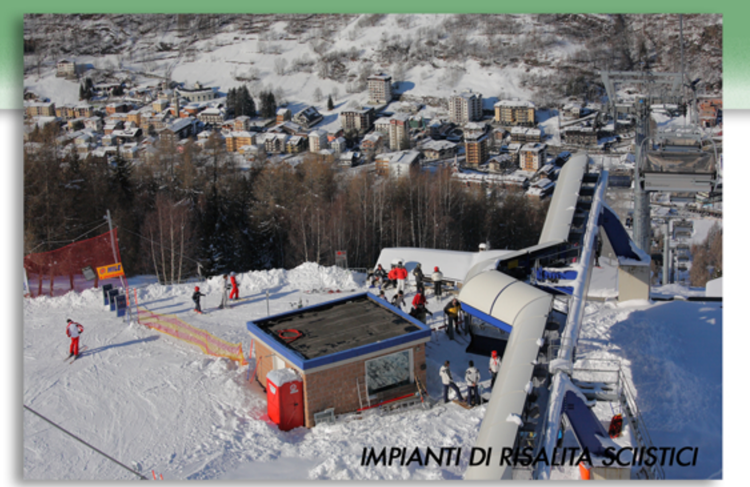
IMPIANTI DI RISORSA SCIISTICI