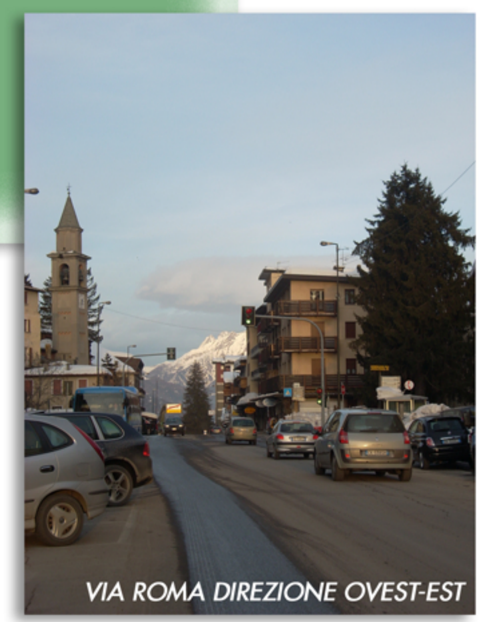
VIA ROMA DIREZIONE OVEST-EST