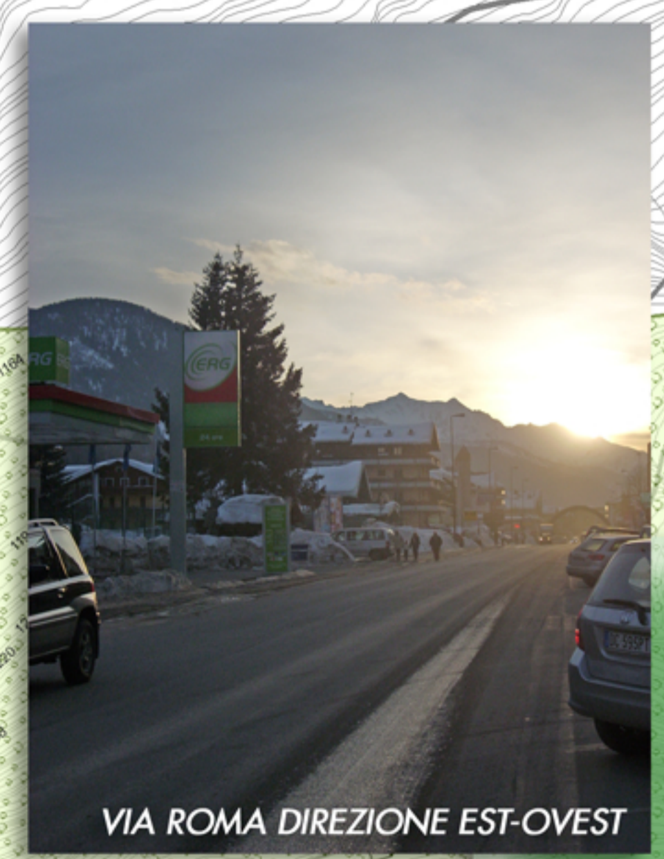
VIA ROMA DIREZIONE EST-OVEST